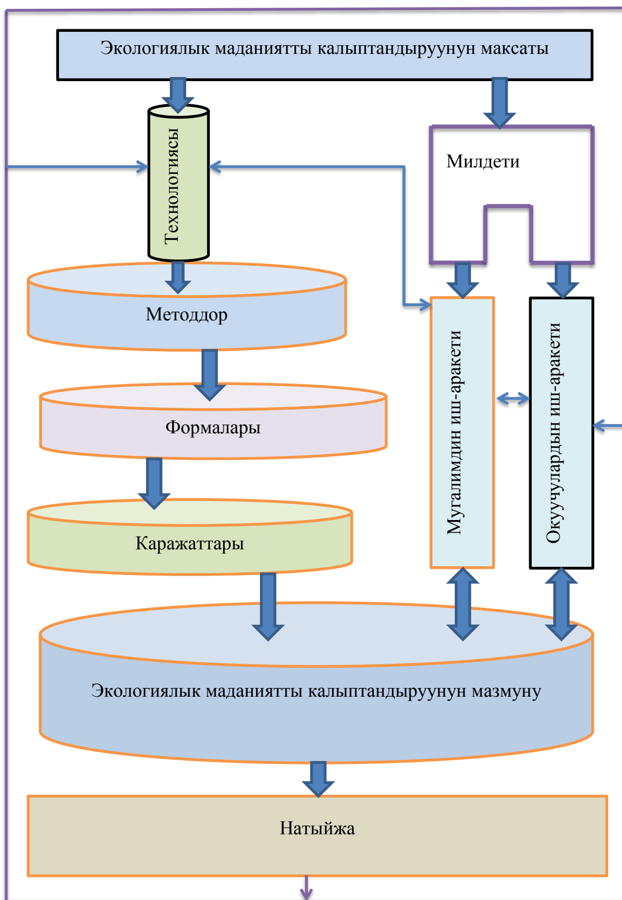
Сүрөт 1. – Экологиялык маданиятты калыптандыруу процесси